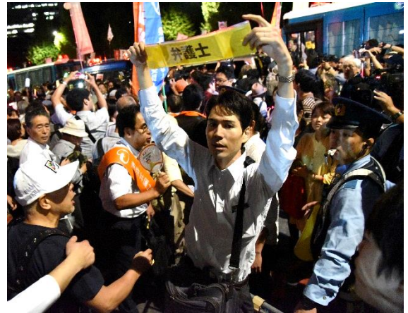
(左上) デモを規制する警官が突然、鉄柵越しに参加者の首に手をかけて拘束しようとした。 (右上) 次の瞬間、後ろの警官が腕を振り上げて「公妨（公務執行妨害）！公妨！」と叫んだ。 (左下) 周囲の参加者は「不当逮捕だ！」「離せ！」とロ々に抗議して、揉み合いとなった。 (右下) 近くにいた見守り隊の弁護士が駆け付けてすぐに仲裁に入り、騒ぎを納めて逮捕に至らず、事なきを得た。