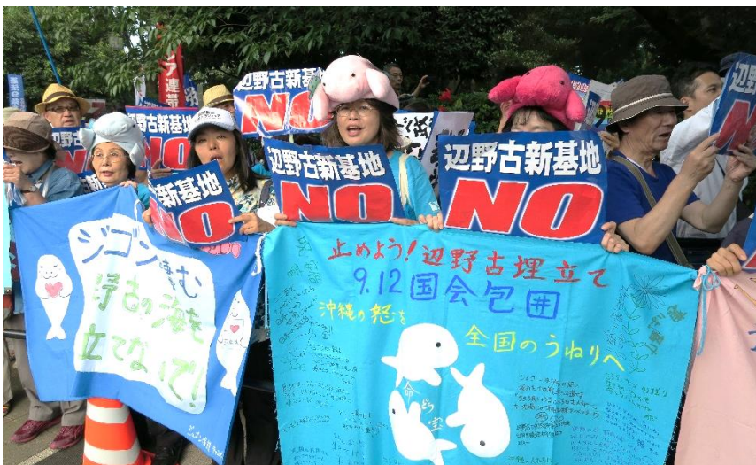
ジュゴンの帽子をかぶりプラカードを掲げて抗議する参加者（国会正門前）

沖縄県名護市の辺野古新基地建設をめぐる政府と沖縄県による集中協議が決裂して終了し、12日朝、中断していた辺野古沿岸部での埋め立て工事が再開されました。一方、翁長知事は14日にも辺野古埋め立て承認の取り消し手続きに入る考えを明らかにしました。これを受けて9月12日、国会前では辺野古新基地建設に反対する「止めよう！辺野古埋め立て 9.12 国会包囲行動」が開かれ、集まった2万2