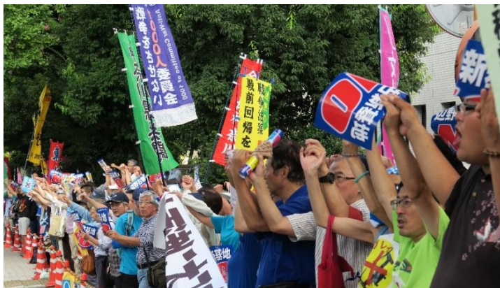
手をつなぎヒューマンチェーンで国会包囲（首相官邸前）

改善されるわけがない。中国の軍拡派を喜ばせるだけだ。新基地建設阻止の闘いは、アジアの平和を守る闘いだ」と訴えました。さらに、辺野古新基地建設のために本土から土砂を搬出させることに反対している団体や、沖縄の学生グループ、オスプレイの東京・横田基地配備に反対する運動団体など、各地の反基地団体や市民団体などからのアピールが続きました。