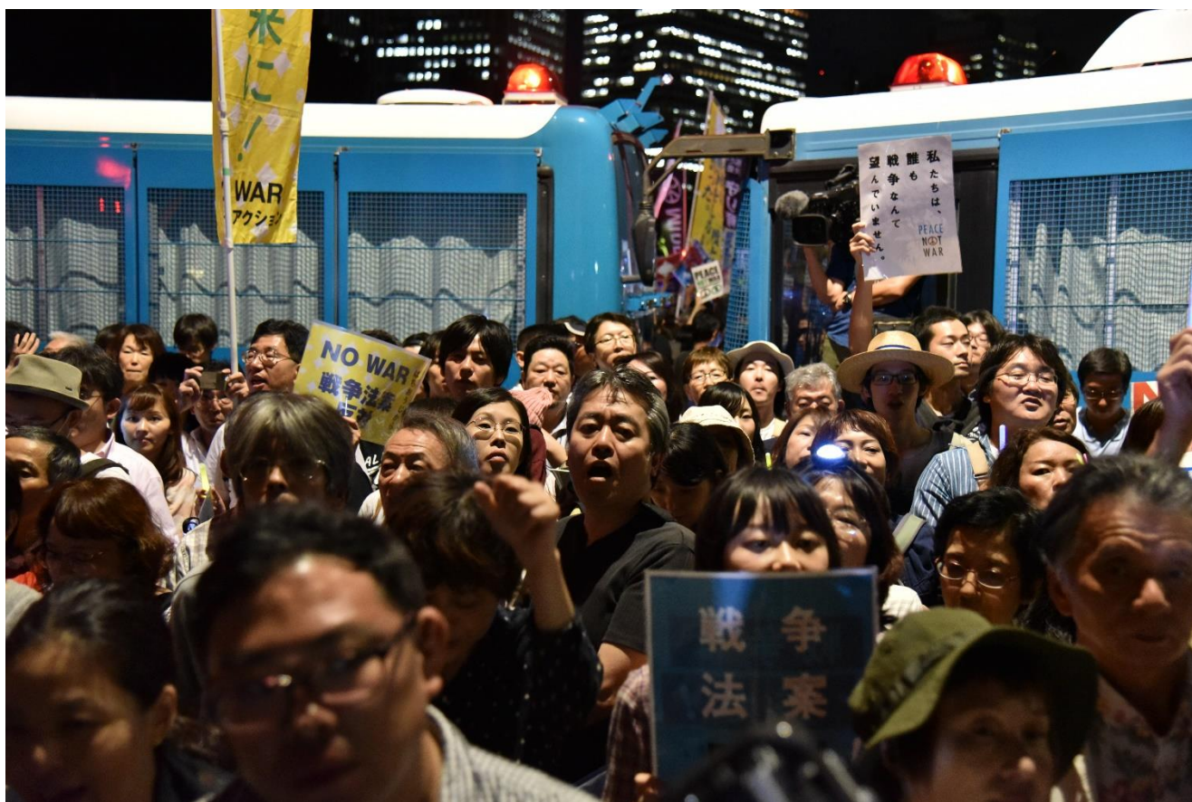
国会正門前の道路は警察の装甲車などに囲まれたが、数万人の市民はその合間をぬって抗議の声を上げ続けた