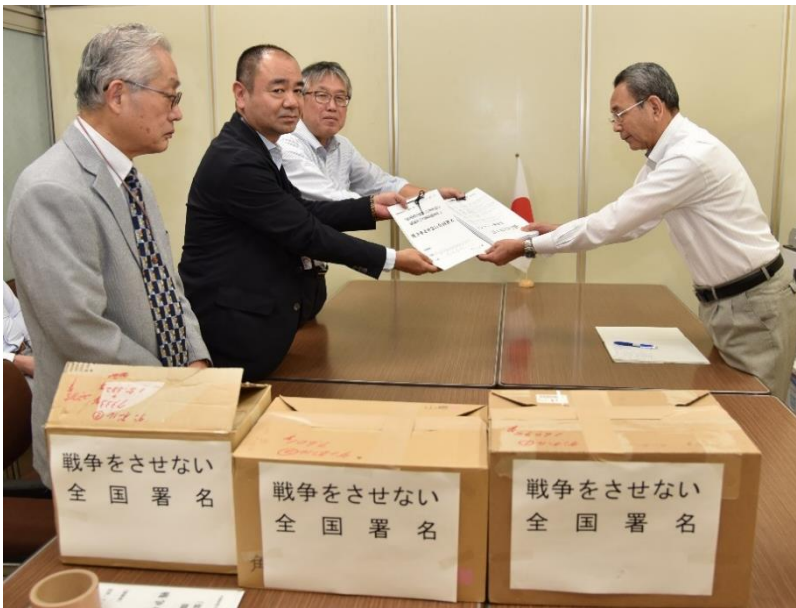
第3次集約で追加提出した4万6千筆の全国署名（内閣府）

戦争をさせない1000人委員会は9月15日、今年1月から全国に呼びかけて集めた「戦争をさせない全国署名2015」の第3次集約の追加提出分、4万6410筆（オンライン署名1万5382筆含む）を内閣府官房総務課請願担当に提出し、請願者の声をしっかりと受け止め、官邸に届けることを要請しました。これに対して担当者は、「署名は即日官邸へ届ける」ことを約束しました。